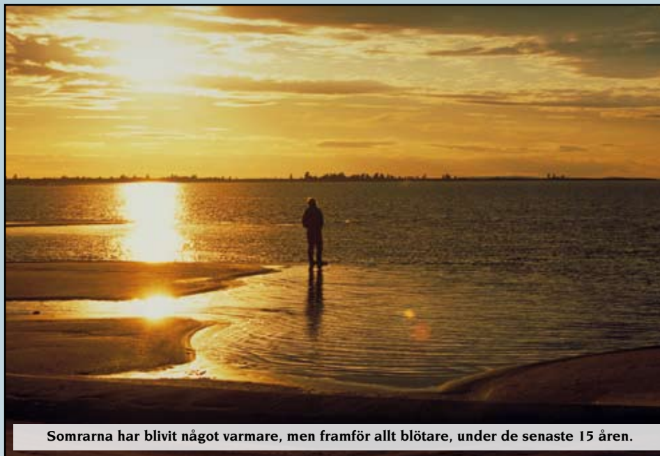
Somrarna har blivit något varmare, men framför allt blötare, under de senaste 15 åren.

procent i nästan hela Norrbotten. Det är framför allt somrarna som blivit blötare, i Luleåregionen handlar det om 25-30 procent mer regn under juni-augusti. Nederbörden under hösten har däremot minskat med cirka tio procent.