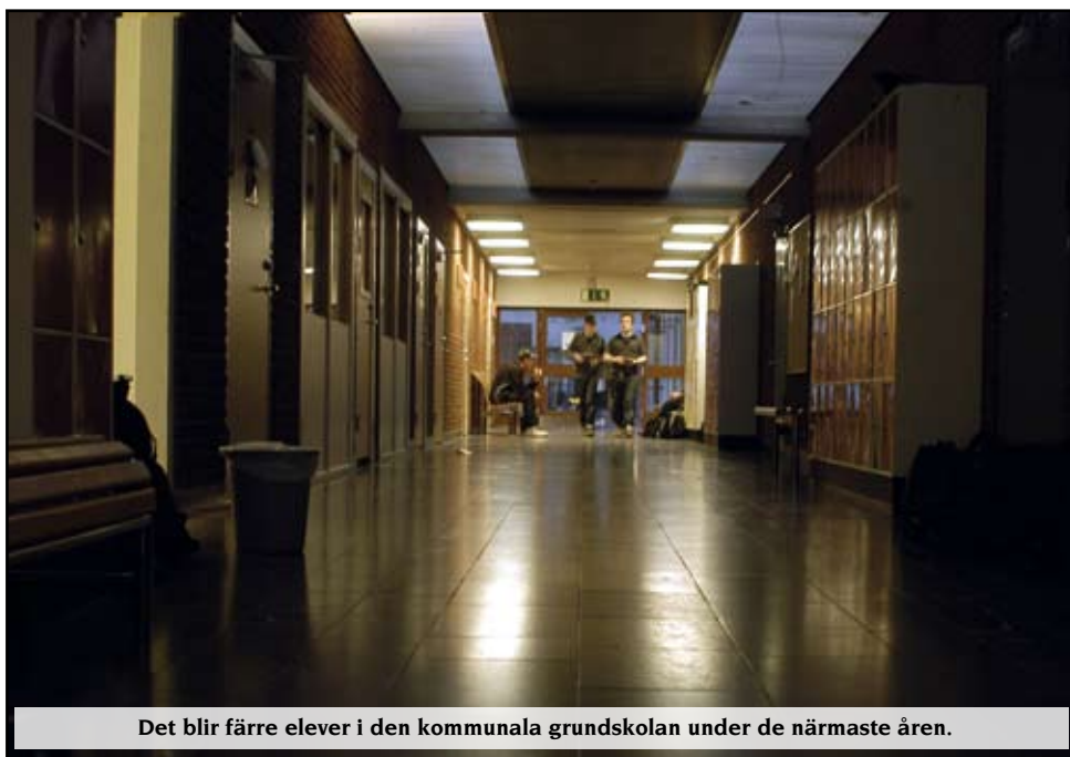
Det blir färre elever i den kommunala grundskolan under de närmaste åren.

görs på tre sätt: personalminskningar, ny organisation och skolnedläggningar.