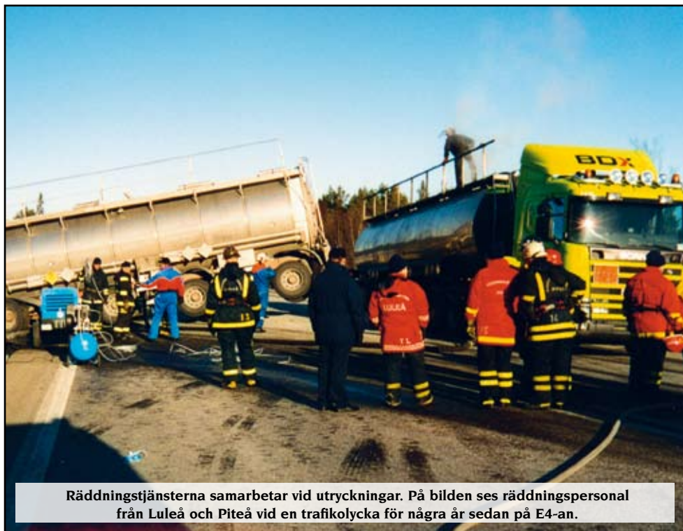
Räddningstjänsterna samarbetar vid utryckningar. På bilden ses räddningspersonal från Luleå och Piteå vid en trafikolycka för några år sedan på E4-an.

Det samarbetas som aldrig förr i Fyrkanten. Enbart kommunerna är inblandade i ett 80-tal större och mindre projekt.