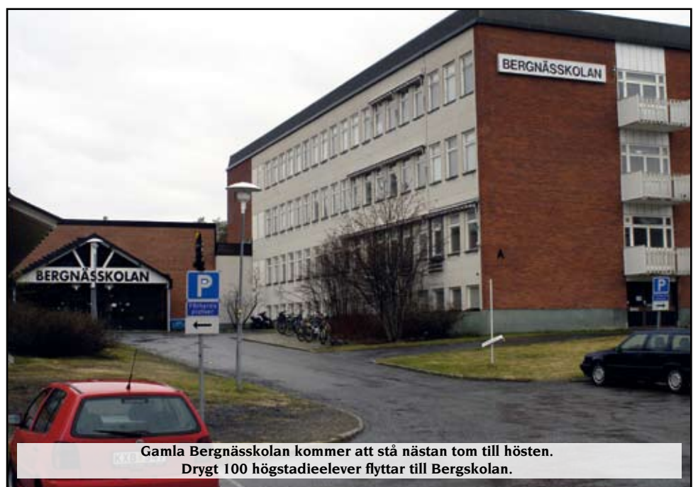
Gamla Bergnässkolan kommer att stå nästan tom till hösten. Drygt 100 högstadiel elever flyttar till Bergskolan.

Gymnasiebyn är däremot proppfull med ungdomar, trots det fristående NTI-gymnasiet. Särskolan berörs inte i någon större utsträckning.