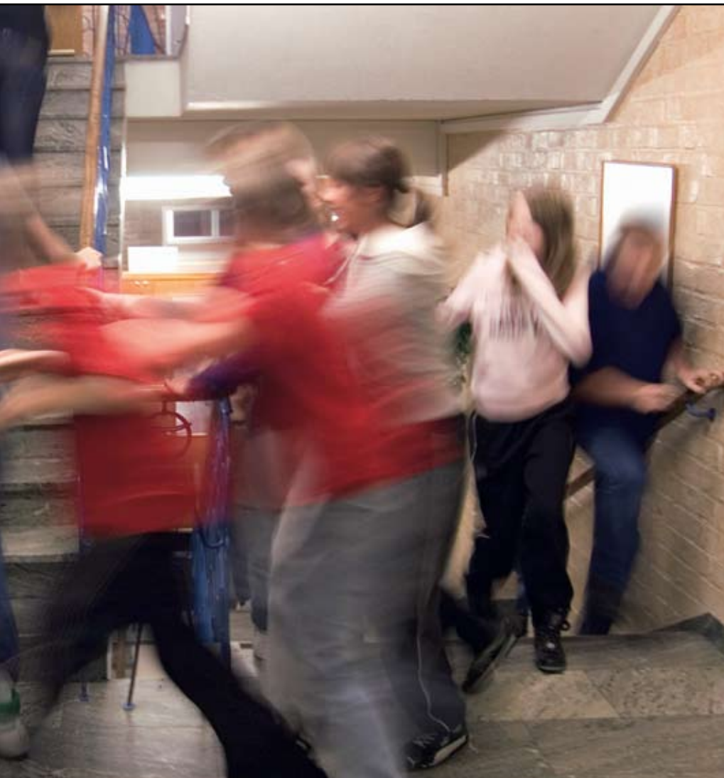
väntar i skolorna de närmsta åren. Många elever får flytta till nya skolor.