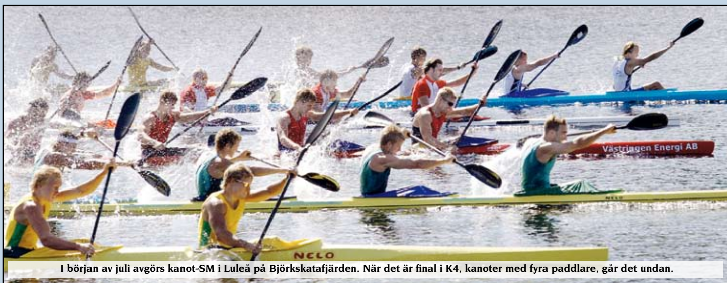
I början av juli avgörs kanot-SM i Luleå på Björkskatafjärden. När det är final i K4, kanoter med fyra paddlare, går det undan.

• Turismen. Kommunernas turistorganisationer marknadsför hela regionen. Visit Luleå och Boden Turism satsar på gemensam annonsering i Nordnorge.