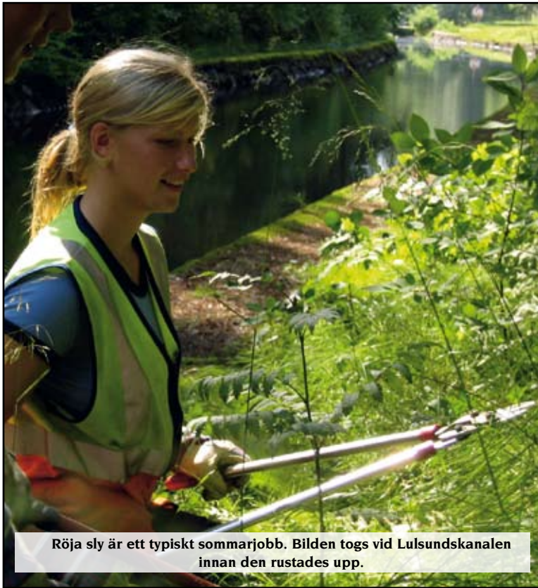
Röja sly är ett typiskt sommarjobb. Bilden togs vid Lulsundskanalen innan den rustades upp.