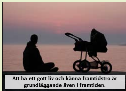
Att ha ett gott liv och känna framtidstro är grundläggande även i framtiden.

I Luleå har vi sånt som inte alla andra har. Snön, naturen, kontrasten mellan stad och land, kontrasten mellan industri och akademi, spelet mellan ljus och mörker är bara några exempel. I kommunen har vi också nära till nästan allt. För att kunna vara en attraktiv stad och kommun behöver vi ha kunskap om vilka tillgångar vi har och ha förmågan att utveckla dessa. Människor