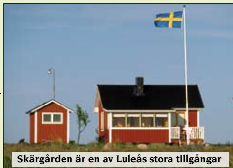
Skärgården är en av Luleås stora tillgångar