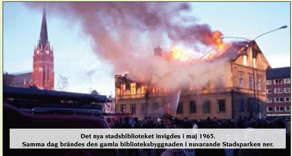
Det nya stadsbiblioteket invigdes i maj 1965. Samma dag brändes den gamla biblioteksbyggnaden i nuvarande Stadsparken ner.

Den 1 januari 1969 inrättades nuvarande Luleå kommun.