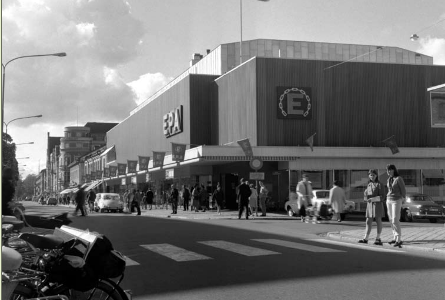
Lönerna och levnadsstandarden ökade kraftigt under både 50- och 60-talen. En shoppingkultur växte fram och Epa, nuvarande Åhléns, var ett av de nya köptempen.